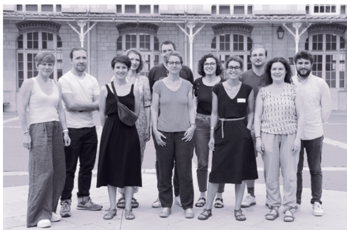
Le Bureau de l'APSES 2023-2024

La lettre de l'APSES est publiée par l'Association des professeurs de Sciences Économiques et Sociales, association loi 1901.