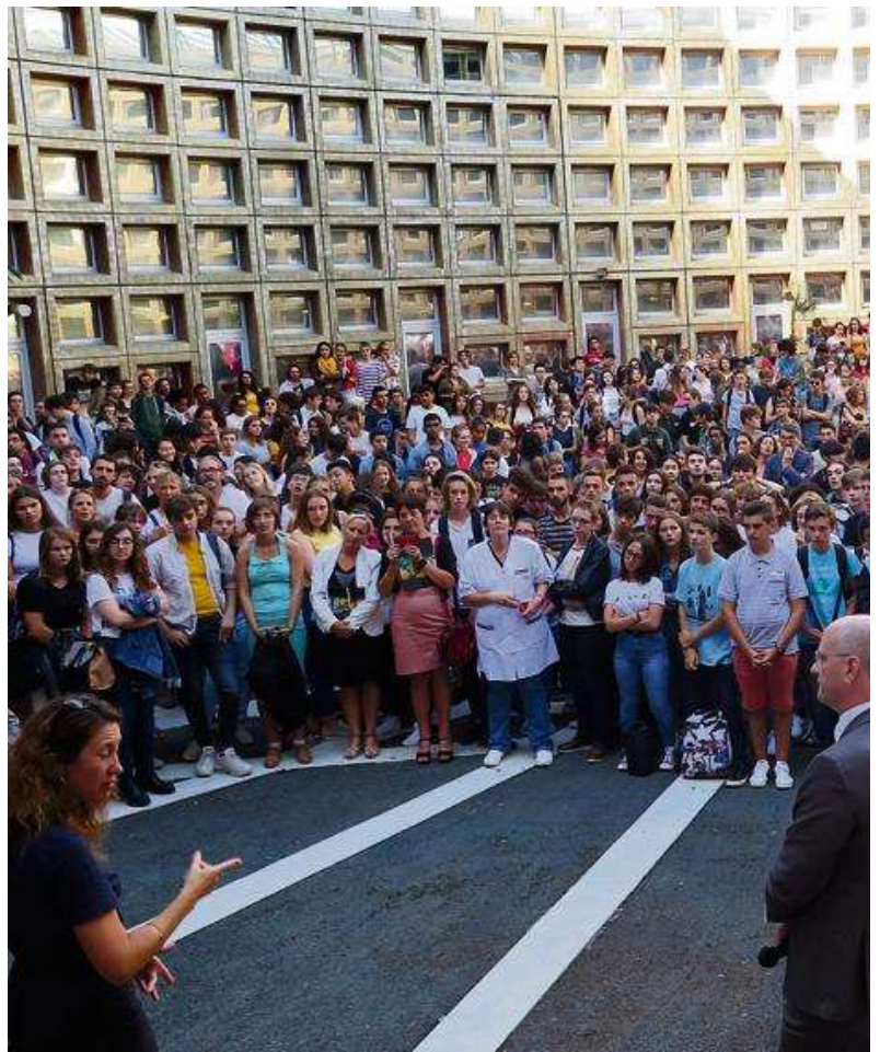
Jean-Michel Blanquer lors de sa visite au lycée de Jaunay-Marigny (Vienne), le 10 septembre.

En français, par exemple, le nombre d'œuvres à étudier dans leur intégralité augmente. Les élèves de 1 re auront quatre œuvres imposées à lire pour le baccalauréat – contre trois au choix du professeur auparavant –, avec une forte revalorisation de la dissertation, exercice choisi aujourd'hui par 10 % des candidats. En mathématiques, le programme suit des recommandations remises en février par le mathématicien et député de l'Essonne, Cédric Villani (La République en