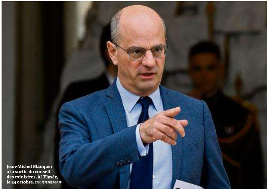
Jean-Michel Blanquer à la sortie du conseil des ministres, à l'Élysée, le 24 octobre.